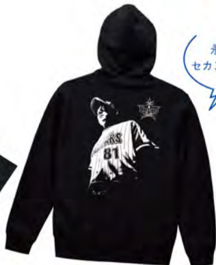
横浜愛、三浦新監督 / ジップパーカー 黒のボディにフルジップ仕様。左胸には監督の背中と「横浜愛」入り。¥7,000