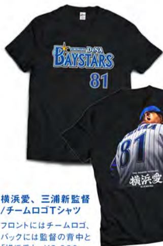
横浜愛、三浦新監督 / チームロゴTシャツ フロントにはチームロゴ、バックには監督の背中と「横浜愛」。¥3,900