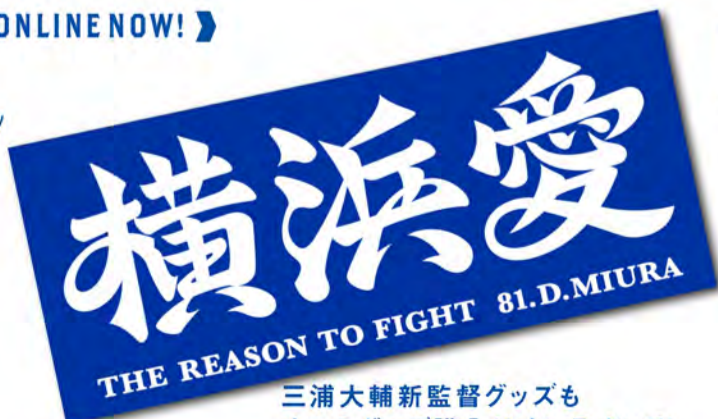
横浜愛/フェイスタール このフェイスタールを早くスタジアムで掲げたいね。¥2,000